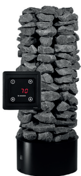
Rakka E2, musta