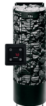
Kalla E2, musta