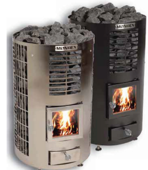
Klapi, RST ja musta