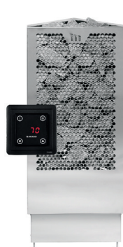
Aura E2, RST