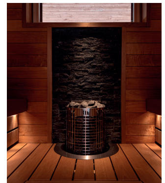
Kalla E2, RST