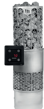
Kaira E2, RST