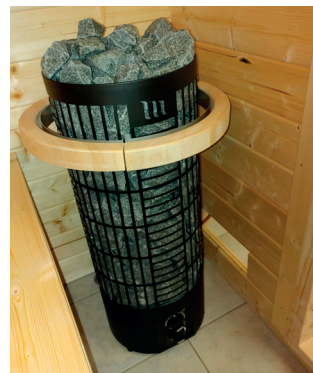
Tahko M, musta suojakaiteella