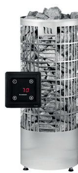
Tahko E2, RST