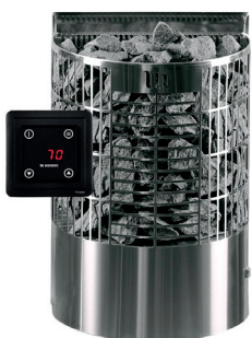
Teno E2, RST