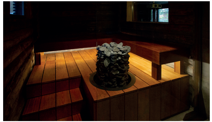
Rakka-lattiakiuas upotettuna lauteisiin