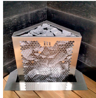
Aura E2, RST