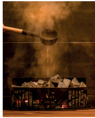
Teno E2, musta

Hiisi-kiukaassa yhdistyvät kehittynyt tekniikka ja tyylikäs musta graniitti. Kiukaassa on käytetty samaa elektroniikkaa kuin Louhi-kiukaassa. Erillisohjaimella voi säätää saunan lämpötilaa asteen tarkkuudella. Asennetaan seinää vasten, joten kiukaan taakse ei tarvita suojaetäisyyttä. Kaikki paino myös jaloilla eli ei tarvitse vahvistettua seinärakennetta. Lisävarusteena saatavana valosarja, joka viimeistelee saunan tyylin.