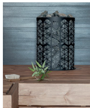
Kaira E2, musta