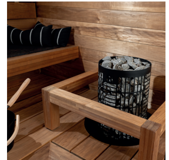
Tahko E2, musta